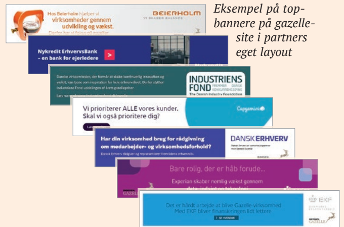
Eksempel på top-bannere på gazelle-site i partners eget layout