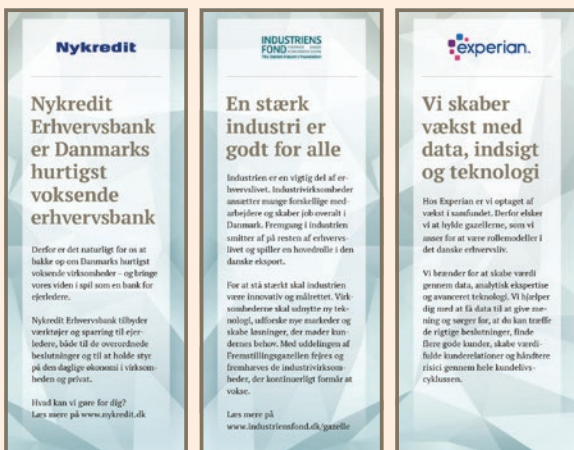
Eksempler på partners egne budskaber på partnervæg