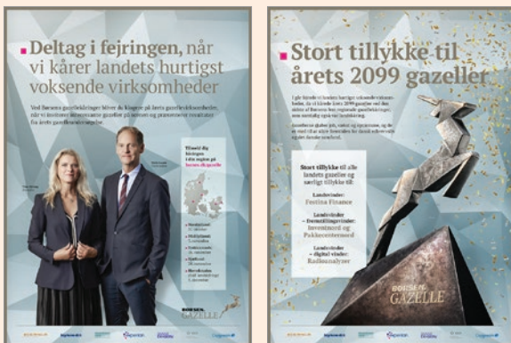
Eksempel på helsides brandingannonce